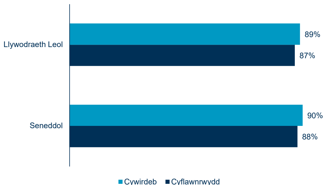
Ffigur 1.1 Cyflawnrwydd a chywirdeb cofrestrau llywodraeth leol a seneddol yng Nghymru

Sylfaen (amhwysol): Seneddol: Cyflawnrwydd 1,410; Cywirdeb 1,429, Llywodraeth Leol: Cyflawnrwydd 1,485; Cywirdeb 1,461